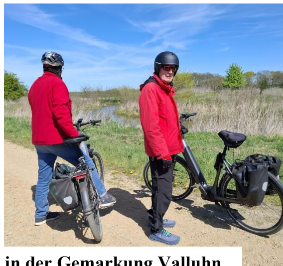
Auf dem Boize-Radweg in der Gemarkung Valluhn

Gesamtstrecke der Tourenrunde: ca. 55 km.